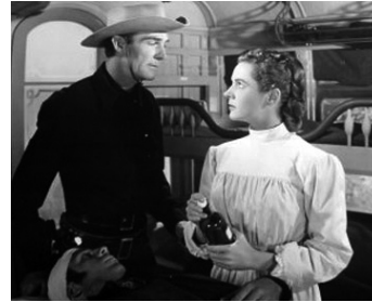
1949 CANADIAN PACIFIC (Canadian Pacific) d'Edwin L. Marin avec Jane Wyatt