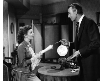
1951 LA FURIE DU TEXAS (Fort Worth) d'Edwin L. Marin avec Helena Carter