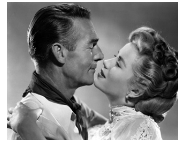
1948 FAR WEST 89 (Return of the Bad Men) de Ray Enright avec Anne Jeffreys