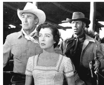
1956 SEPT HOMMES À ABATTRE (Seven Men from Now) de Budd Boetticher avec Gail Russell, Lee Marvin