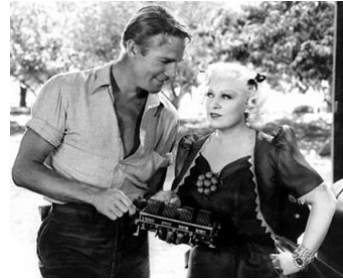
1936 GO WEST YOUNG MAN (Go West Young Man) d'Henry Hathaway avec Mae West