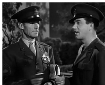
1941 LES GARS DE TRIPOLI (To the Shores of Tripoli) d'H. Bruce Humberstone avec John Payne