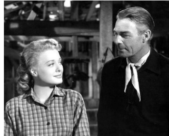
1951 LE CAVALIER DE LA MORT (Man in the Saddle) d'André de Toth avec Ellen Drew