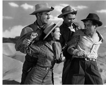
1949 LES AVENTURIERS DU DÉSERT (The Walking Hills) de J. Sturges avec Ella Raines, John Ireland, W. Bishop