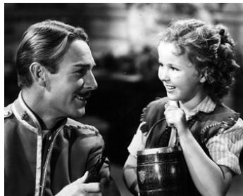
1938 SUZANNAH (Suzannah of the Mounties) de William A. Seiter avec Shirley Temple