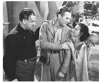
1935 LA SOURCE DU FEU (She) d'Irving Pichel avec Nigel Bruce, Helen Mack