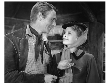
1940 LES PIONNIERS DE LA WESTERN UNION (Western Union) de Fritz Lang avec Virginia Gilmore