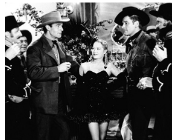
1940 LA CARAVANE HÉROÏQUE (Virginia City) de M. Curtiz avec Miriam Hopkins, Errol Flynn