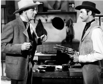
1950 COLT 45 (Thundercloud) d'Edwin L. Marin avec Zachary Scott