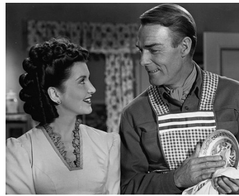
1947 LA DESCENTE TRAGIQUE (Albuquerque) de Ray Enright avec Catherine Craig