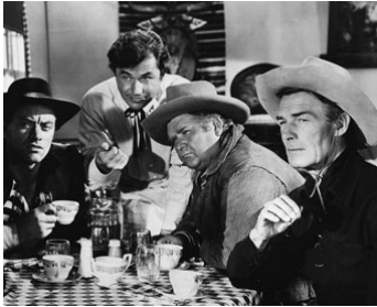
1949 FACE AU CHÂTIMENT (The Doolins of Oklahoma) de G. Douglas avec John Ireland, Noah Beery Jr