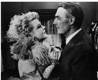
1955 VILLE SANS-LOI (A Lawless Street) de Joseph H. Lewis avec Angela Lansbury