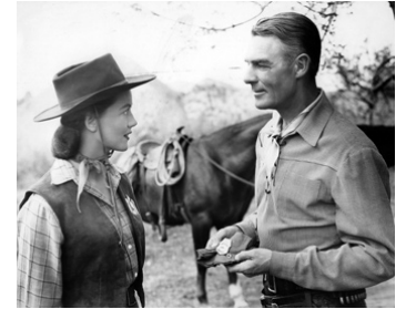
1949 L'HOMME DU NEVADA (The Nevadan) de Gordon Douglas avec Dorothy Malone