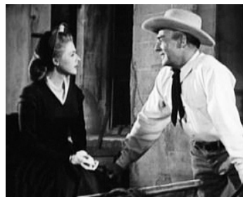
1955 LES RÔDEURS DE L'AUBE (Rage at Dawn) de Tim Whelan avec Mala Powers