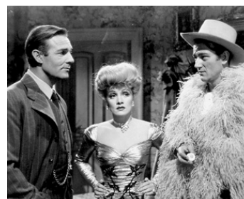
1942 LES ÉCUMEURS (The Spoilers) de Ray Enright avec Marlene Dietrich, John Wayne