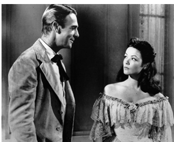
1941 LA REINE DES REBELLES (Belle Starr) d'Irving Cummings avec Gene Tierney