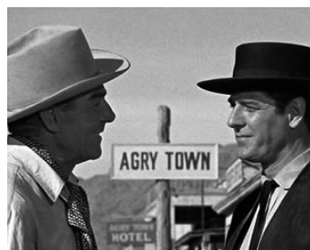
1958 L'AVENTURIÈR DU TEXAS (Buchanan rides alone) de Budd Boetticher avec Craig Stevens