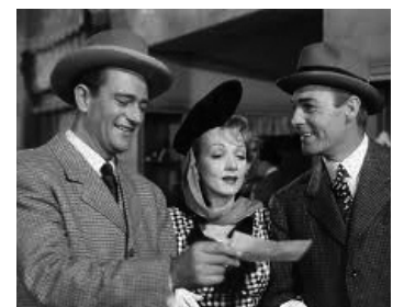
1942 PITTSBURGH (Pittsburgh) de Lewis Seiler avec John Wayne, Marlene Dietrich