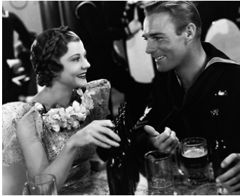
1936 EN SUIVANT LA FLOTTE (Follow the Fleet) de Mark Sandrich avec Harriet Nelson