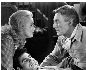
1958 LE COURRIER DE L'OR (Westbound) de Budd Boetticher avec Karen Steele, Michael Dante