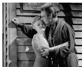
1943 LES DESPÉRADOS (The Desperados) de Charles Vidor avec Claire Trevor