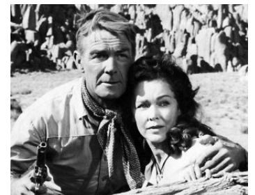
1957 L'HOMME DE L'ARIZONA (The Tall T) de Budd Boetticher avec Maureen O'Sullivan