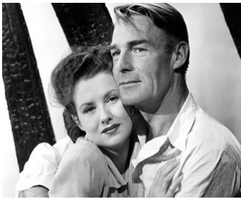
1945 SOUS LE CIEL D'ORIENT (China Sky) de Ray Enright avec Ruth Warrick