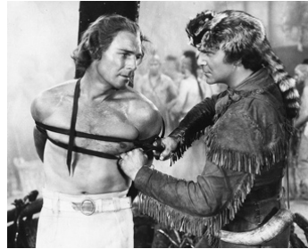
1936 LE DERNIER DES MOHICANS (The Last of the Mohicans) de George B. Seitz avec Henry Wilcoxon