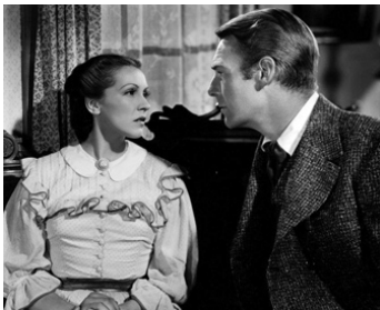
1938 LE BRIGAND BIEN-AIMÉ (Jesse James) d'Henry King avec Nancy Kelly