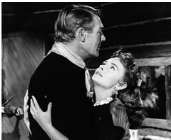
1952 LE RELAIS DE L'OR MAUDIT (Hangman's Knot) de Roy Higgins avec Donna Reed