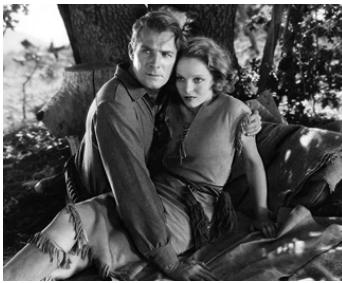
1932 L'HÉRITAGE DU DÉSERT (Heritage of the Desert) d'Henry Hathaway avec Sally Blane