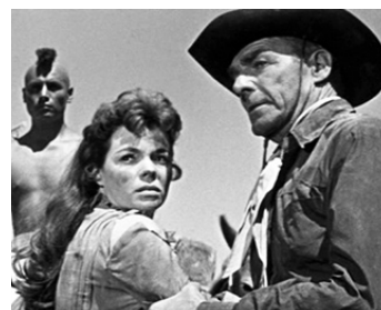
1959 LA PRISONNIÈRE DES COMANCHES (Comanche Station) de Budd Boetticher avec Nancy Gates