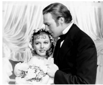
1935 ROSES DE SANG (So Red the Rose) de King Vidor avec Margaret Sullavan