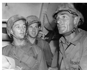
1943 L'HÉROÏQUE AVENTURE (Gung Ho !) de Ray Enright avec Robert Mitchum