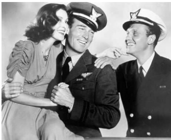
1939 GARDE-CÔTES (Coast Guard) d'E. Ludwig avec Frances Dee, Ralph Bellamy