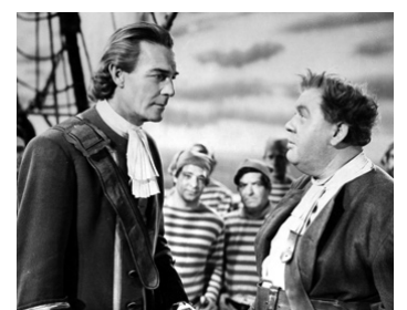
1945 CAPITAINE KIDD (Captain Kidd) de Rowland V. Lee avec Charles Laughton