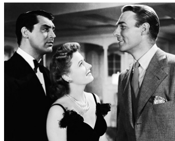
1940 MON ÉPOUSE FAVORITE (My favorite Wife) de Garson Kanin avec Cary Grant, Irene Dunne