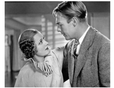
1935 ROBERTA (Roberta) de William A. Seiter avec Irene Dunne