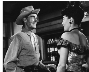
1954 TERREUR À L'OUEST (The Bounty Hunter) d'André de Toth avec Marie Windsor