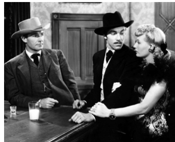
1939 L'AIGLE DES FRONTIÈRES (Frontier Marshal) d'Allan Dwan avec Cesar Romero, Nancy Kelly