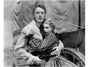
1938 LA RUÉE SAUVAGE (The Texans) de James P. Hogan avec Joan Bennett