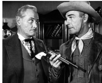
1953 LES MASSACREURS DU KANSAS (The Stranger wore a Gun) d'A. De Toth avec George Macready