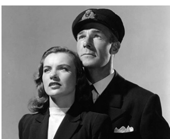
1943 CORVETTE K. 225 (The Nelson Touch) de Richard Rosson avec Ella Raines